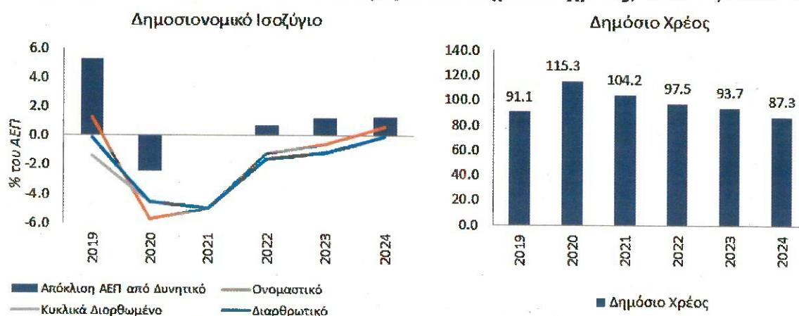
Διάγραμμα 2 - Δημοσιονομικό ισοζύγιο και Δημόσιο χρέος, % ΑΕΠ, 2020-2024 π

2021-2024: Προβλέψεις, Υπουργείο Οικονομικών